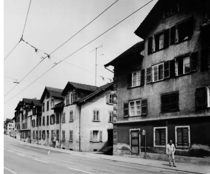
Plattencover «Reussbühl» (1992).

Thomas ist 13 Jahre jung, als ihm die Mutter den grössten Wunsch erfüllt: Sie schenkt ihm 1980, mitten in der Blütezeit von Punk und Ska, eine elektrische Gitarre und eine Lederjacke. Der Sohn sitzt fortan stundenlang in seinem Zimmer, übt die Akkorde rauf und runter, bis er irgendwann merkt: Das ist mehr als nur ein Hobby. Es ist die Art des Ausdruckes. Das bin ich. Mit 16 Jahren steht er auf dem