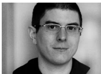
13.