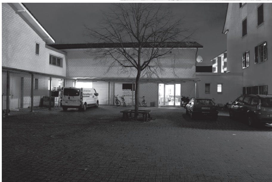
Zwischenbühne heute