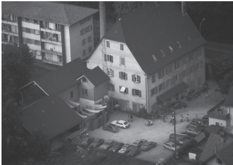
Bilddokumentation Sarah Steiger (aus dem Zwischenbühne-Archiv)